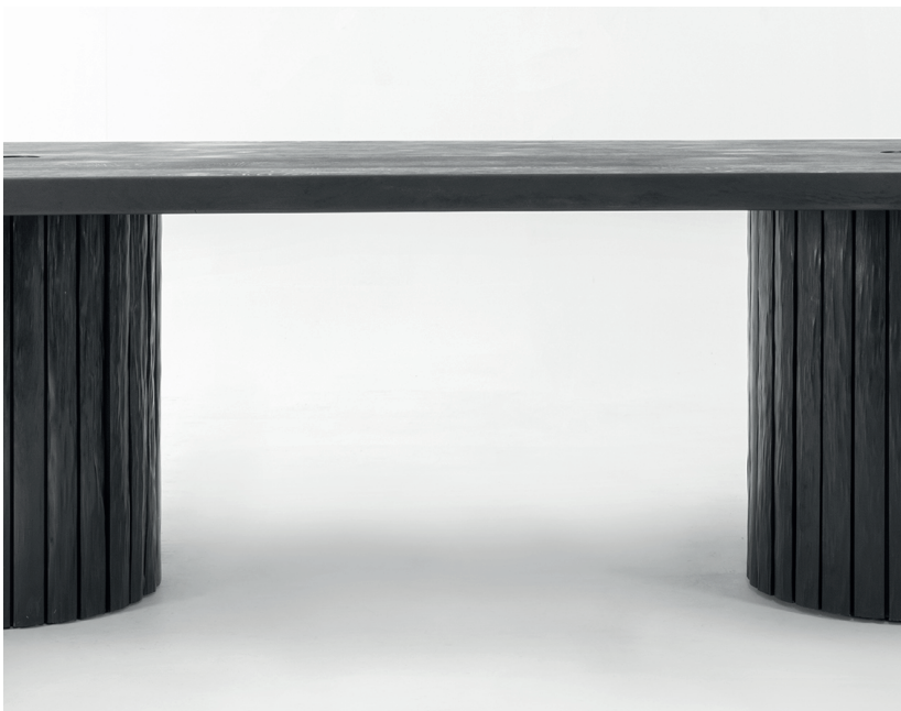
Table à manger longue en cèdre Kitayama naturel ou teinté. Plateau en bois ou en pierre. Pièces signées.